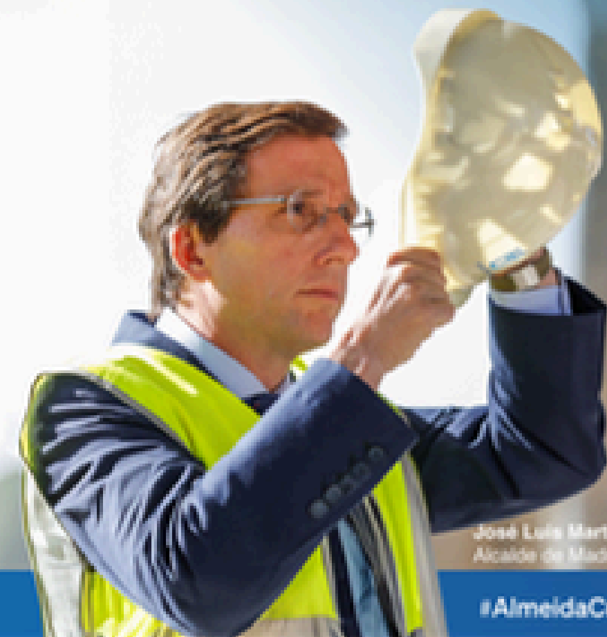
José Luis Martínez-Almeida Alcalde de Madrid

+100 nuevos EQUIPAMIENTOS Construimos un Madrid mejor